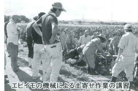
エビイモの機械による土寄せ作業の講習

JA京都やましろ京田辺市えびいも部会が主体となって、京都府農山漁村伝承技能登録者を講師として開講しています。新規栽培者7名とNPO法人1団体が、芽だし作業から定植、土寄せ、施肥、摘葉、病害虫防除等、栽培に必要な技術と知識を学んでいます。同時に塾生は各自のほ場で栽培に挑戦しており、産地の拡大につながっています。