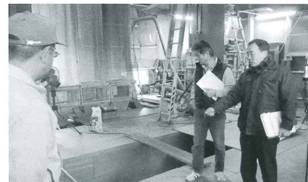
製茶工場での研修 みんなで安全対策を検討