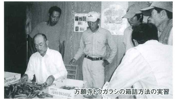
万願寺トウガラシの箱詰方法の実習

24年度は、すでに効果を上げている京田辺市のナス、木津川市のナス、宇治田原町のキュウリに加えて、京田辺市のエビイモ、管内全域の万願寺トウガラシの養成塾を開講しています。