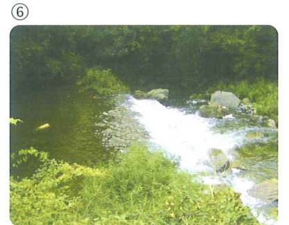
⑥ 最近では珍しい自然石の落差工は、今なおその機能を発揮しています。

アクセス 大阪駅から、JR関西線経由で約1時間20分。 京都駅から、JR奈良線、JR関西線経由で約1時間。 ※ダイヤの詳細については各運行会社でご確認ください。