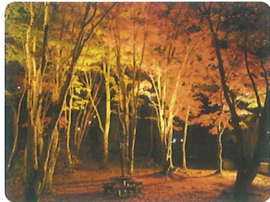
② もみじ公園 夜間ライトアップ