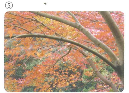
⑤ 秋には、河川に沿って植樹された落葉樹が、色鮮やかに紅葉します。

④ とうけつ 『甌穴』とは 川底が固い岩等でできた川で、増水時、流れが渦状になり、その流れに小石等が巻き込まれて円形に川底に当たり続けることでできる、すり鉢状の穴のことです。