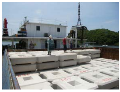
被覆ブロック搬入