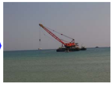
被覆ブロック据付