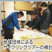
地域団体によるサイクリングツアーの検討

起伏に富んだ地形も楽々走れるeバイク(スポーツ電動アシスト自転車)を活用したガイドツアー、地域の隠れた名所や暮らしを体験できる里山サイクリング、スイーツや花を楽しむフルーツライド。今、管内では、自転車を活用した新たな動きが広がっています。