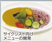
サイクリスト向けメニューの開発