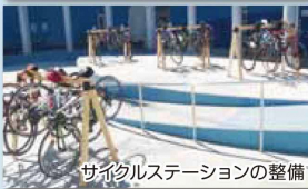
サイクルステーションの整備