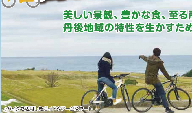
eバイクを活用したガイドツアーがスタート

美しい景観、豊かな食、至る所に点在する魅力ある観光スポット。 丹後地域の特性を生かすため、自転車を活用する動きが広がっています!