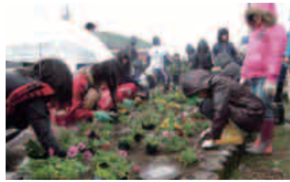
地域の子どもたちによる花壇整備(峰山駅)

乗るみんなが明るく癒やされる「花の鉄道づくり」を応援してください。皆様の会費を活用して駅などに花や樹木を植えていきます。花壇にオーナープレートを設置するほか特産品の割引などの特典も。1口1,000円から。