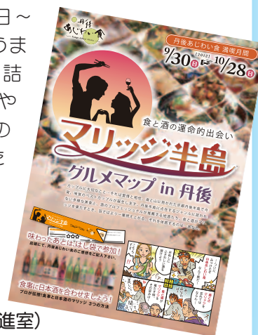
マリッジ半島 (後索)

丹後あじわい食・満喫月間(9月30日～10月28日)の間、丹後の自然が育んだうまいもんを提供する52のお店がぎっしり詰まったグルメマップを、KTRの各有人駅や観光案内所などで配布しています。丹後の秋は、それぞれの店舗が工夫を凝らした「丹後あじわい食」と、相性の良い丹後の地酒の組み合わせ(食と酒のマリッジ)を体感してください。