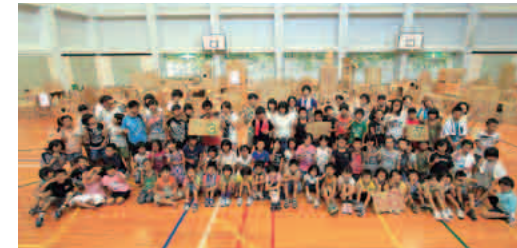
巨大段ボール迷路づくりなどを行った子どもキャンプ

京都市内の学生たちが、過疎化、高齢化の進む農村地域に滞在し、地域の人々と一緒に活性化に取り組む「京都Xキャンプ」を与謝野町滝・金屋地区で実施しました。「X」とは、芸術、環境、建築などさまざまな可能性を持つ学生が参加するということです。地域の小学生との子どもキャンプや、屋台カフェ、里山の再生など、約1ヶ月にわたり25人の学生たちが滞在、活動しました。