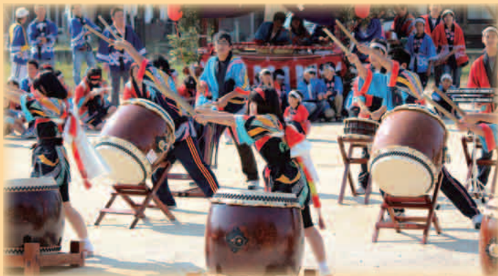
弥栄溝谷太鼓(秋祭り中学生演奏)