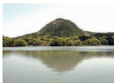
ジオサイトの一つ「かぶと山」(京丹後市久美浜町)

山陰海岸ジオパークの認知度向上や観光誘客などを目的として、10月20日に「ジオパークディスカバリー」を運行します。京都府、兵庫県、鳥取県の3府県にまたがる山陰海岸ジオパークエリアを結ぶ日本初のルートであり、ジオサイトの見学をはじめ、発着駅でのイベントや地域の特色をいかした昼食弁当など、盛りだくさんの内容でおもてなしします。