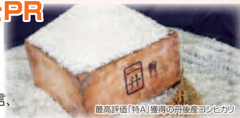
最高評価「特A」獲得の丹後産コシヒカリ