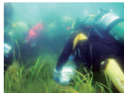
海洋高校生へのアマモ調査指導

海洋センターでは、水質浄化機能を持つアサリやアマモを増やす取り組みを行っています。地元漁業者により、垂下育成(えさが多い中層に、いかだからつるして育成)アサリの試験出荷も行われ、身入りが良いと好評を得ています。また、アマモ場復活を目指して、海洋高校と共同で試験を行っており、今秋には昨年よりも規模を拡大した種まき試験を予定しています。