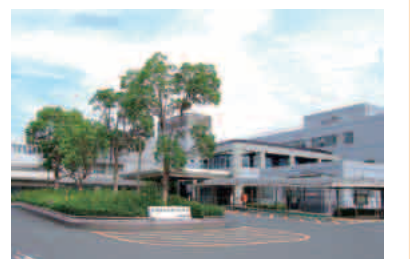
府立与謝の海病院

来年4月の附属病院化に向けて、救急室の拡張整備など救急医療の充実や地域総合医療講座の開設、症例検討システムの整備などを進めています。丹後の中核病院として地域医療を担う診療機能の充実や高度医療の提供とともに、医師確保対策の推進を図り、医療提供体制を一層充実させます。