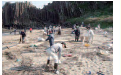
同実行委員会による立岩周辺の海岸清掃

自治会などの地域団体から、まちの活性化につながる府道、河川など府管理施設の改良事業を提案してもらい、地域と市町村と府が手を取り合って実施していく地域主導型公共事業を本年度から始めました。9月の提案審査会で、丹後管内では立岩周辺清掃実行委員会(京丹後市)による立岩海岸周辺プロジェクトが採択されました。