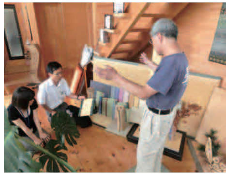
丹後ええもん工房 2012 (後索)

今年度は織物、工芸、食品の23工房が集まりました。ものづくりの現場を直接見ながら、工房の職人さんとゆっくりお話もできます。3カ所回ると抽選で50人にするスタンプラリーも実施中(平成25年1月末応募締切)です。