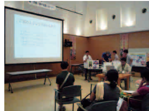
丹後あじわいの郷マルシェなどで連携商品を発信

新たな地域ブランドの創造や、地域経済の活性化を図るため、農林漁業者と中小企業者が連携した商品開発を支援しています。今年度は、丹後管内から酒かすを使用したスイーツの開発など6件が採択されました。