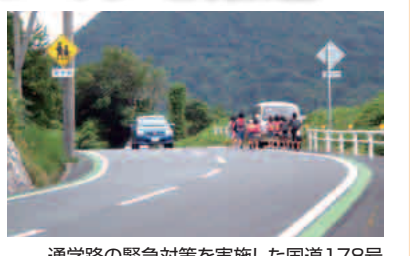
通学路の緊急対策を実施した国道178号(京丹後市丹後町砂方～間人)

丹後管内の府管理道路通学路12カ所について、市町、教育委員会及び警察と連携して、通学路であることを見せる緑色の路肩カラー舗装や警戒標識の設置などの緊急対策を実施しました。また、市町村とともに住宅の耐震化を支援しています。費用負担3千円でできる耐震診断や、耐震改修への補助(最高30万円)、簡易改修への補助(最高30万円)などの支援制度をご活用ください。