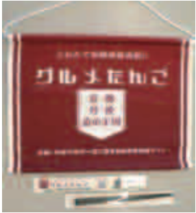
プロモーショングッズ

丹後の食材を活用している飲食店や旅館などが一丸となり、「丹後の食」をPRしているサイトです。お得なクーポンやお店のおすすめ料理、キャンペーン情報などが入手できますので、ぜひご覧ください。 ただいま登録店舗も募集中です。 (PR料1,000円/月)