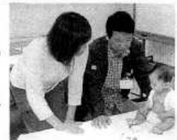
子どもクリニック