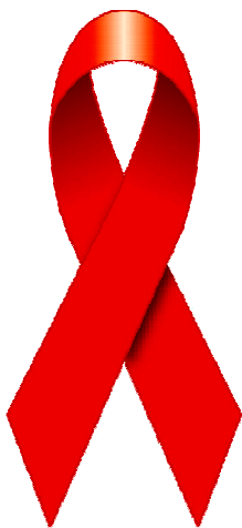
レッドリボン... エイズに対する理解と支援の象徴

エイズは、多くの方が「自分には関係のない病気」だと思いませんか？エイズは、日本、そして京都府の中でも静かに増え続けています。