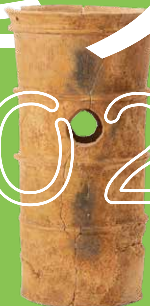
芝山古墳群 (城陽市)