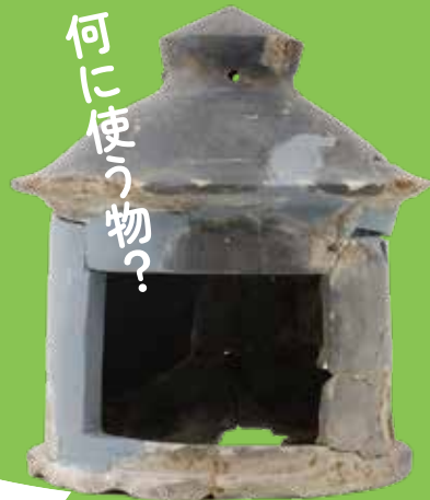
淀水垂大下津町遺跡 (京都市)