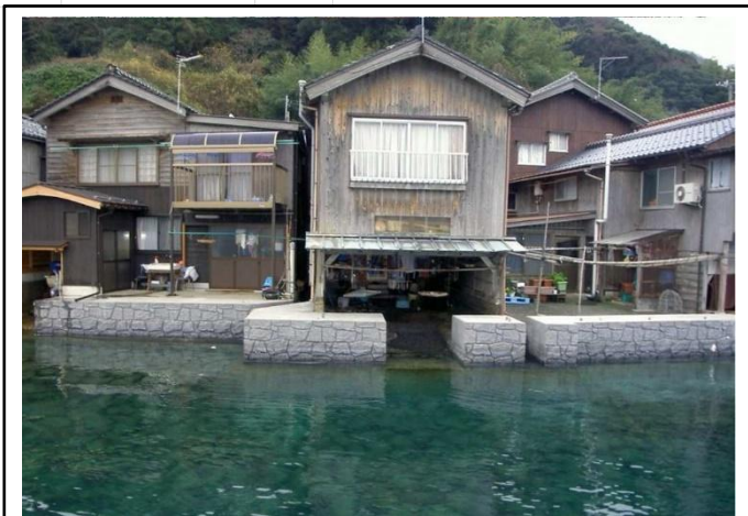
護岸整備後イメージ