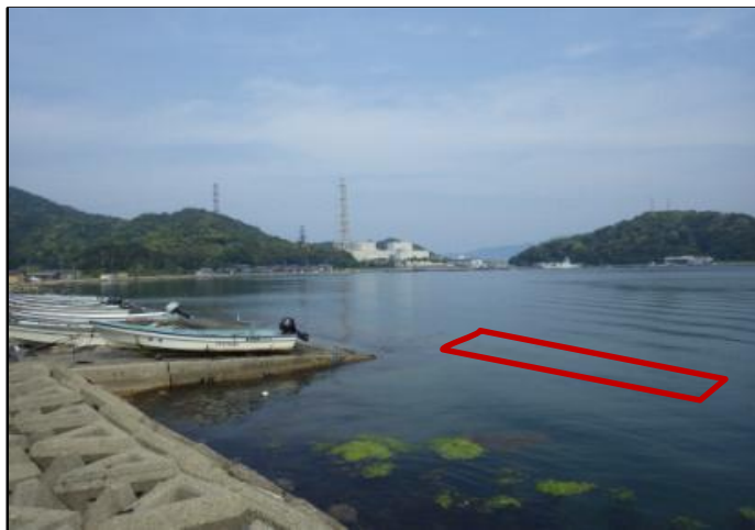
R8年度整備予定箇所