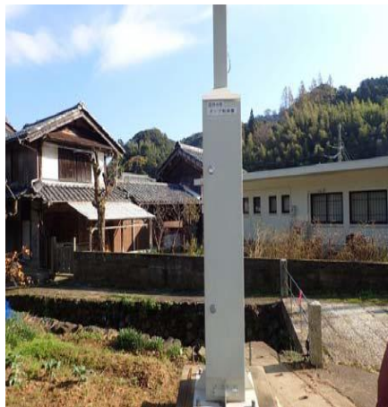
田井4号マンホールポンプ制御盤