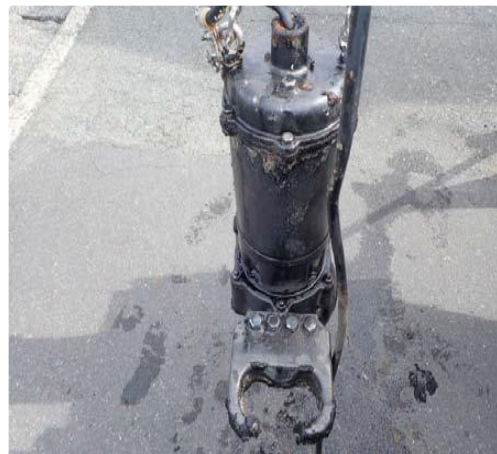
田井1号No.2 マンホールポンプ