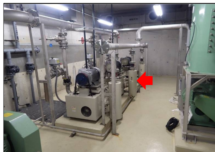
伊根漁港 処理場真空ポンプ