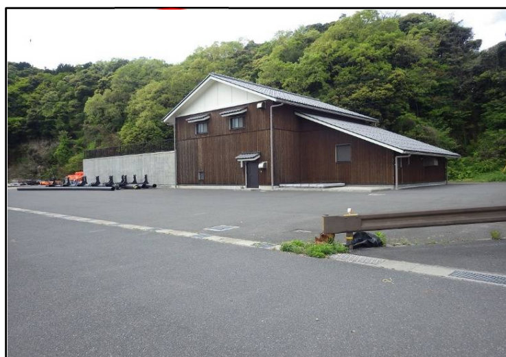
伊根漁港 伊根浄化センター