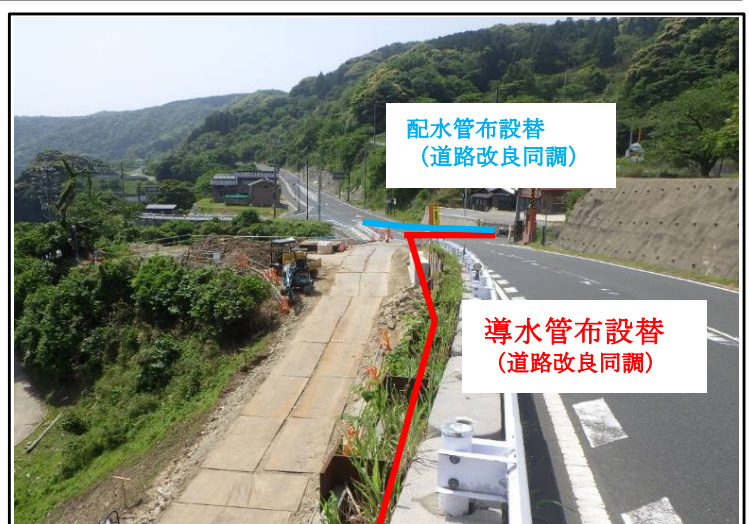
本庄地区導水管・配水管布設