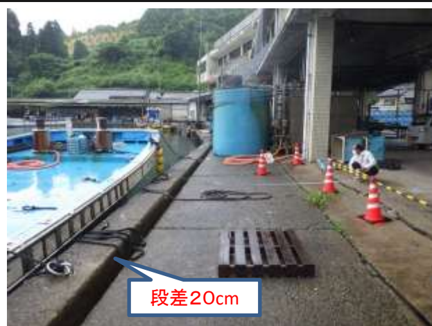
大浦第1岸壁 老朽化状況