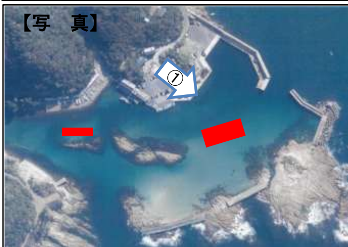
【浜詰漁港】浚渫工事