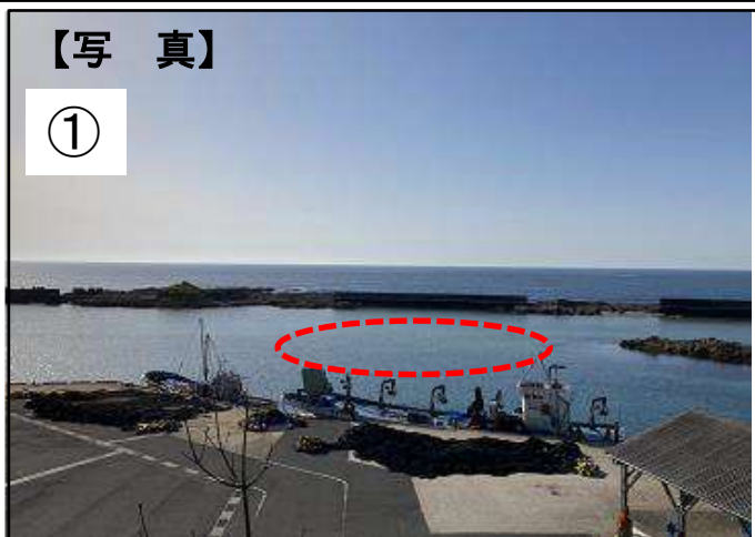
【浜詰漁港】浚渫工事