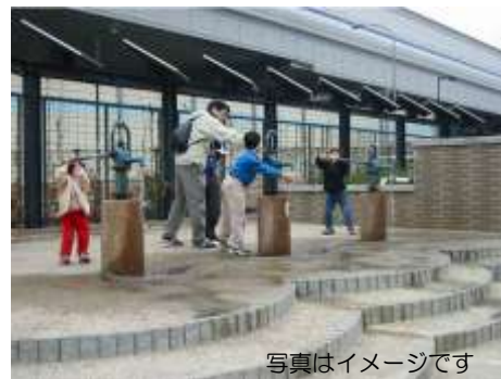
公園の耐震性貯水槽