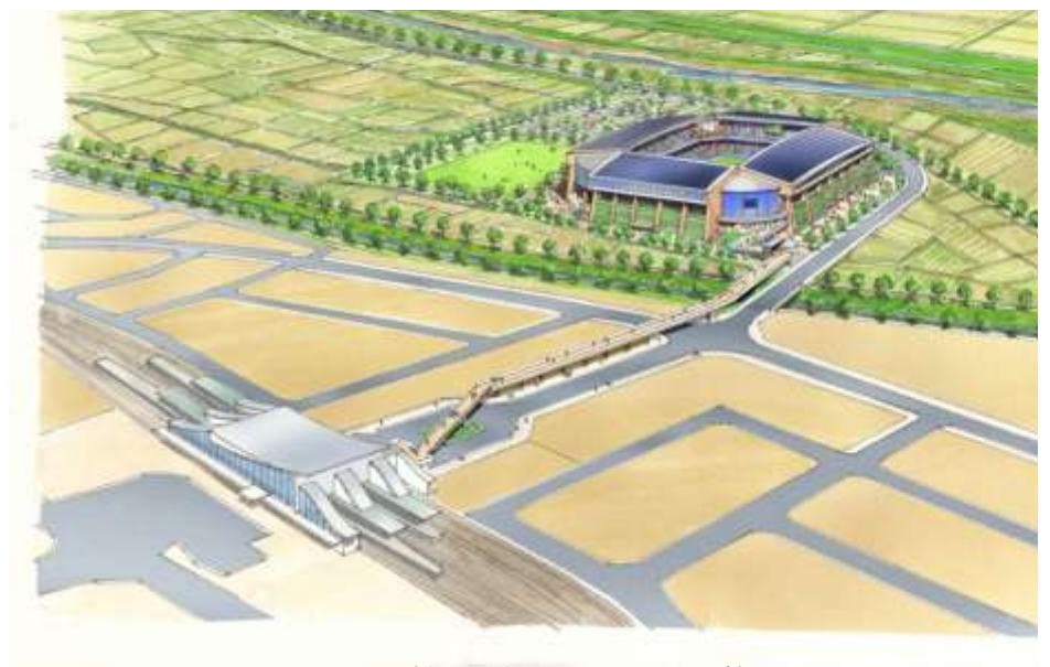
(亀岡市作成イメージ)