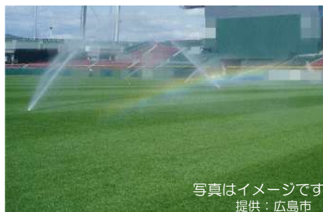
雨水を利用した芝散水