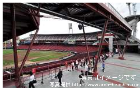
コンコースから見渡せるフィールド