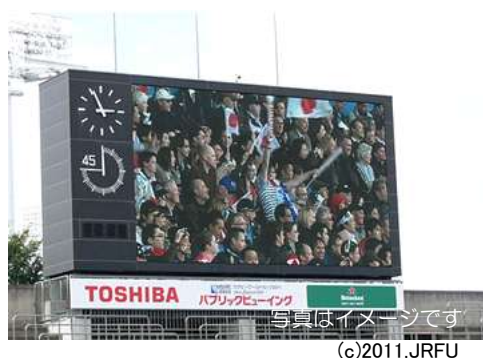
大型映像装置による演出