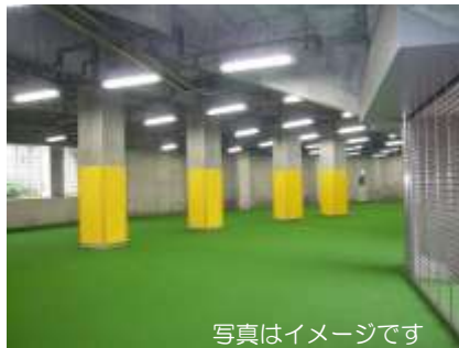
ウォームアップエリア