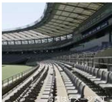
光を通す太陽光発電屋根