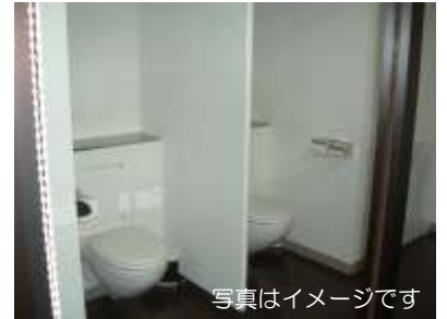
ドーピングコントロール室