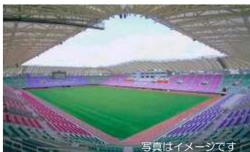
観客席を覆う屋根