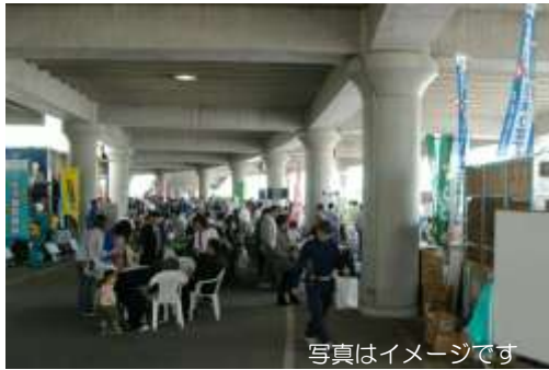
コンコースでのフリーマーケット(イメージ)