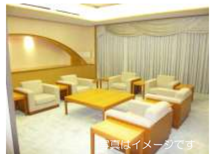
多目的に利用できる VIPルーム