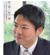
京都女子大学 データサイエンス学部 准教授