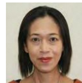
(専)京都中央看護保健大学校 副校長 看護学科学科長