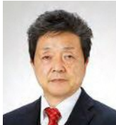
同志社大学 政策学部 教授