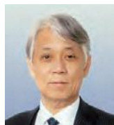
京都大学 経営管理大学院 特定教授