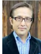
ベンチャーキャピタリスト 京都大学 産官学連携フェロー