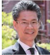
龍谷大学 政策学部 教授