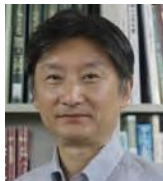
京都女子大学 データサイエンス学部 教授