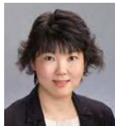
京都産業大学 共通教育推進機構 准教授