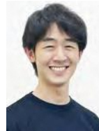
City Digital Inc. 代表取締役