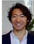
kashinoki 代表 京都大学 IMS特任准教授