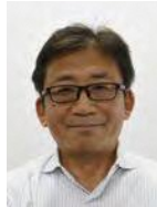
京都大学 IMS特定教授