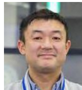
一般財団法人 エン人材教育財団 理事