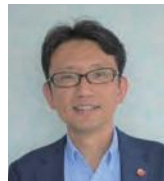
社会福祉法人 京都府社会福祉協議会 事務局長