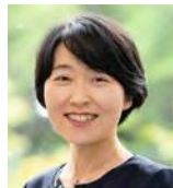
立命館大学 スポーツ健康科学部 教授