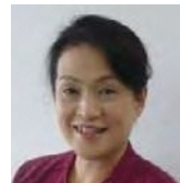
京都きづ川病院 副院長 看護部長