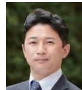
同志社大学大学院 ビジネス研究科 教授