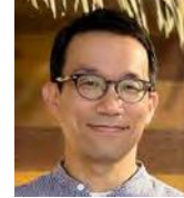
株式会社ビズリーチ キャリア支援室 室長