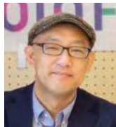
大谷大学 社会学部 准教授