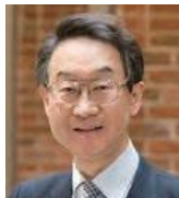
同志社大学大学院 ビジネス研究科 教授