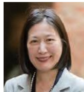
同志社大学大学院 ビジネス研究科 教授