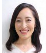
アクセルコンサルティング 株式会社 経営コンサルタント