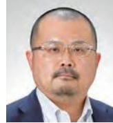
同志社大学 政策学部 准教授