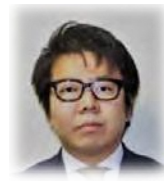
株式会社學匠 代表取締役社長