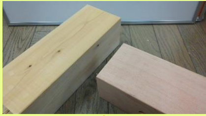
<土台(どだい)、梁(はり)、桁(けた)>