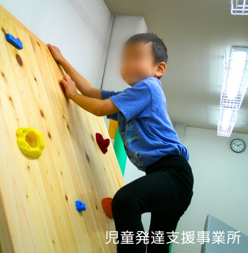
児童発達支援事業所