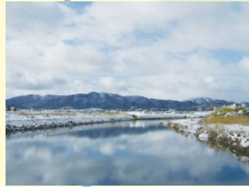
保津橋からの眺め