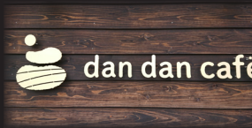
dan dan cafe