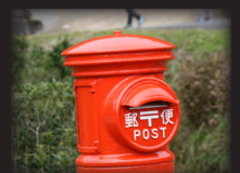
レトロ郵便ポスト