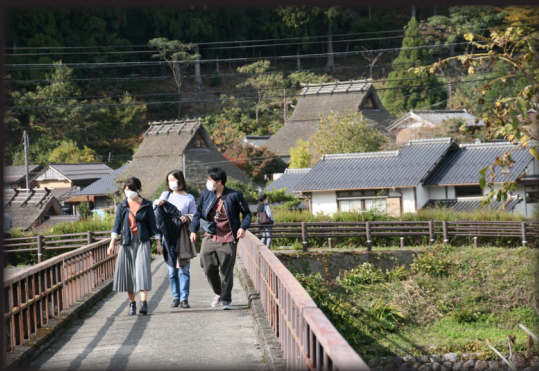
かやぶきの里散策

※土曜ダイヤでのタイムスケジュールです。日祝ダイヤは下段 ( ) となっております。