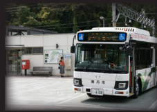
南丹市営バス (日吉駅)