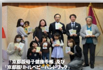
「京都版母子健康手帳」及び「京都版」トルペビ―ハンドブック