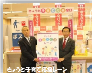
きょうと子育て応援しーん