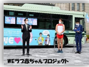
WEラブ赤ちゃんプロジェクト