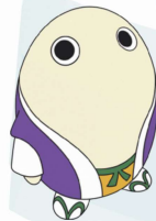
京都府広報監 まゆまる

このような状況をふまえ「梅毒・性感染症に関する研修会」を開催し、梅毒の症状や最新の動向について理解を深め、早期発見と検査の促進や治療に関する最新情報を広く伝えるため、Web形式での研修会を実施いたします。性感染症など最新の知見について受講できる貴重な機会となりますので多数のご参加をお待ちしております。