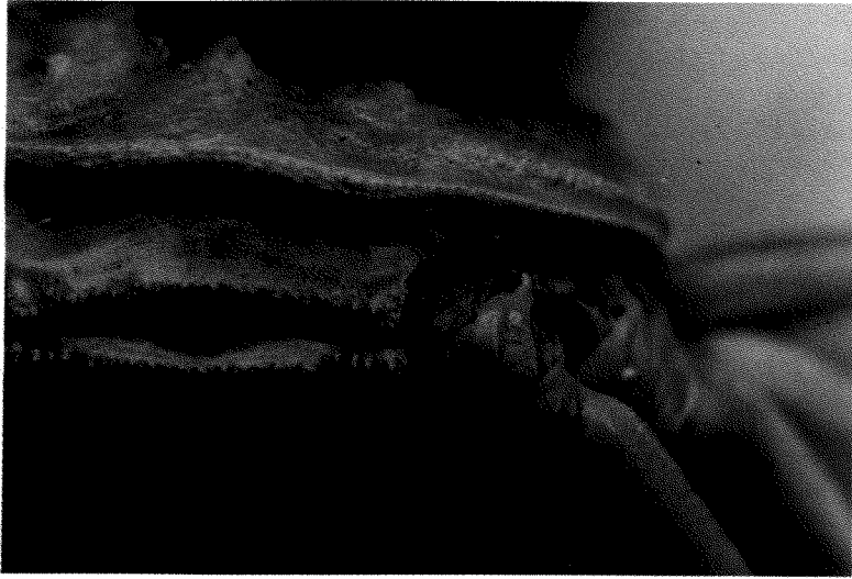
Fig. 3 Showing trace of tag on cast-off shell of zuwai crab ( C. opilio ).

なる標識脱落の危険をさけるためには、装着部位と標識の形状を適切にすればよいことが、この試験からわかった。すなわち、装着位置は甲腹間歩脚基部の底節で、用いる標識には太い細いの段差が無いことである。