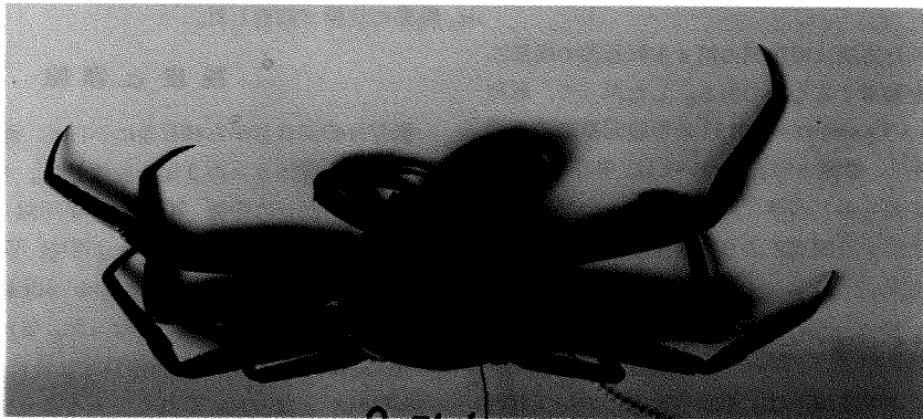
Fig. 2 Anchor tag attached to coxal joint of 4th walking leg.