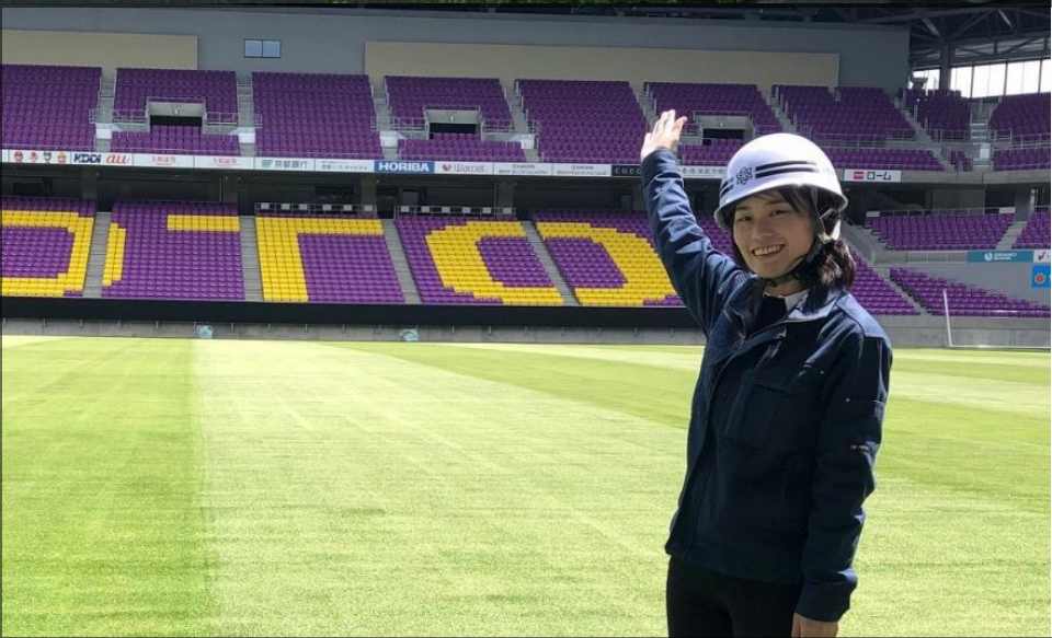
サンガスタジアムby KYOCERA（京都府立京都スタジアム）

京都府職員（一類）採用試験（第3回）に関連して、 3職種※（電気・電子・情報工学、機械、建築） のオンデマンド説明会を開催します。京都府の仕事に興味のある学生のみならず（B4、M2以外の学生も可）、卒業生のみならずのご参加を、お待ちしております。