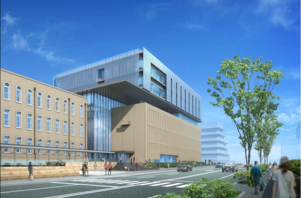
京都府庁の新行政棟・文化庁移転施設（完成イメージ。R4.12竣工）