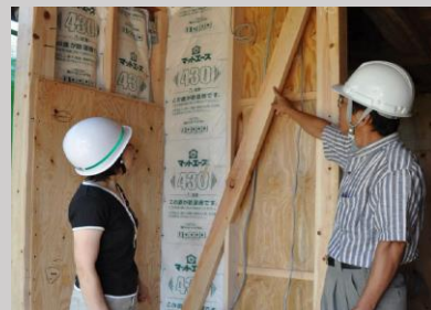
住宅耐震化事業（筋交いの設置）