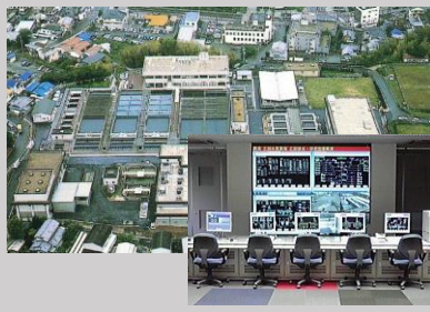
宇治浄水場・モニタリング室