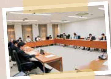
令和2年9月 常任委員会