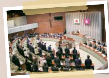
令和4年2月 2月定例会