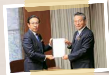
令和3年11月 知事への意見・提言