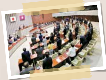
令和2年4月 4月臨時会