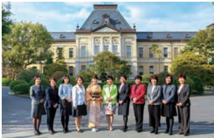
▲府議会の女性議員(平成29年3月22日現在)