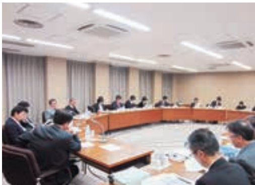
地域創生戦略に関する特別委員会の様子