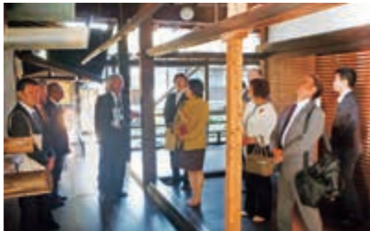
重要文化財である大徳寺塔頭黄梅院(北区)本堂および 庫裏の建造物保存修理の状況を調査しました。(10月26日)

「決算」って何? 「予算」が見積もりであるのに対 して、「決算」は収入と支出の実績で す。議会で行われる「決算の認定」と は、前年度の予算がどのように使わ れて、どのように成果を上げたかな どを審査することです。「予算の議決 権」と同様に議会の大事な権限の一 つです。