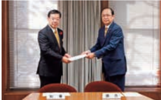
知事への意見・提言(11月4日)

9月定例会において、平成26年度 の歳入や歳出の決算状況について、 10月9日から22日までは担当する 部局ごとに審査を、26日、27日には 現地での調査を、29日には総括的な 質疑を行いました。 この審査の過程において出され た、「健全な財政運営」や「地域振興 の一層の推進」など、指摘・要望事項 36項目を「意見・提言」として取りま とめ、知事に対し、28年度予算編成に 十分反映されるよう求めました。