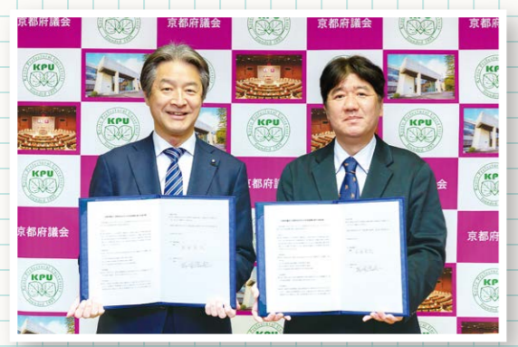
▲包括連携協定締結式の様子