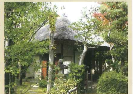
松花堂 茶堂

男山の東山腹に湧泉があり、その傍らに摂社・石清水社（本殿ほか・府指定建造物）が鎮座しています。この湧泉、摂社は、石清水八幡宮の名称の由来となった重要なものです。この石清水社の下方に坊舎の一つの泉坊があり、昭乗が晩年にその一角に結んだ小庵が、松花堂（茶室）なのです。松花堂は、明治時代に男山南東の平地に移築され、現在は八幡市立松花堂美術館の庭園に保存されています（跡地と現敷地は国史跡、松花堂は府指定建造物、松花堂書院、玄関は府登録建造物）。跡地は近年発掘調査されて、古絵図どおりの茶室、露地などの遺構が良好な状態で出土し、主要部分を樹脂加工、露出展示するなど整備されています。なお、現松花堂の庭園の築山は、東車塚古墳（5世紀の全長94mの前方後円墳）の後円部が利用されています。美術館の敷地内の女郎花塚は、謡曲「女郎花」にちなむ謡跡です。