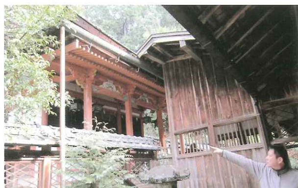
写真9 高神社・本殿（井手町） 府指定文化財・本殿 自動火災報知設備改修