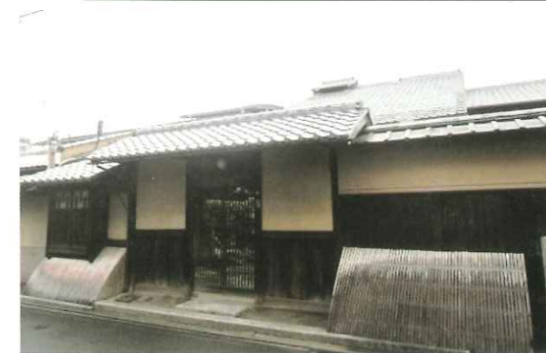
写真1 樂家住宅 (上京区) 国登録文化財・門等の屋根(瓦葺)葺替修理