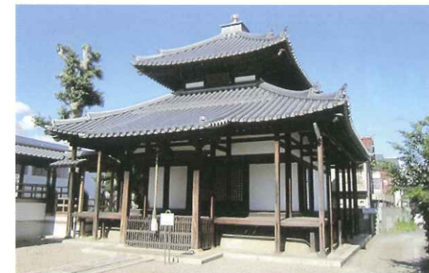
写真3 南真経寺・本堂 (向日市) 府指定文化財・本堂の屋根(瓦葺)修理