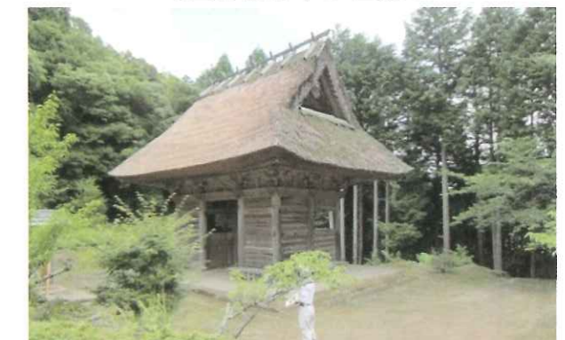
写真6 岩王寺・仁王門 (綾部市) 府登録文化財・仁王門の屋根(茅葺)修理