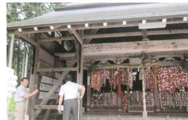
写真5 梅田春日神社・境内社 猿田彦社(京丹波町) 指定文化財・猿田彦社 本殿の屋根(こけら葺)修理