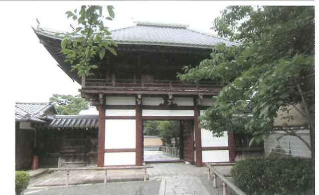
写真2 本法寺・仁王門 (上京区) 府指定文化財・仁王門の扉廻り修理