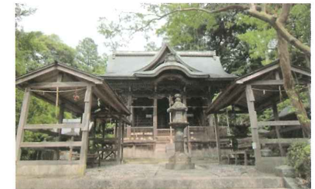
写真4 興能神社・本殿 (亀岡市) 府登録文化財・本堂の屋根修理