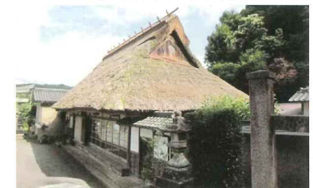
写真8 荒木家住宅・主屋 (舞鶴市) 府指定文化財・主屋の屋根(茅葺)修理