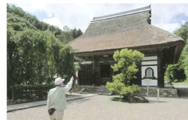
写真7 安国寺・本堂 (綾部市) 府指定文化財・仏殿、庫裏の屋根(茅葺)修理