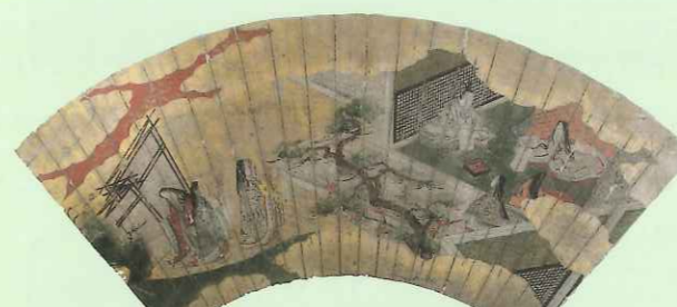
「源氏物語図扇絵 初音」

例えば、源氏物語には、千年という永い歴史や文化があり、その証としての写本や絵巻が残っています。しかし、仮に、それらが無かったとしたら、源氏物語の