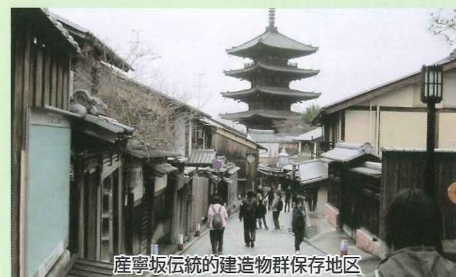
産寧坂伝統的建造物群保存地区

ごく最近では、「歴史まちづくり法」があります。文部科学省(文化庁)と国土交通省、農林水産省の共管の