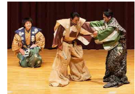
（無形文化遺産シンポジウムの様子）