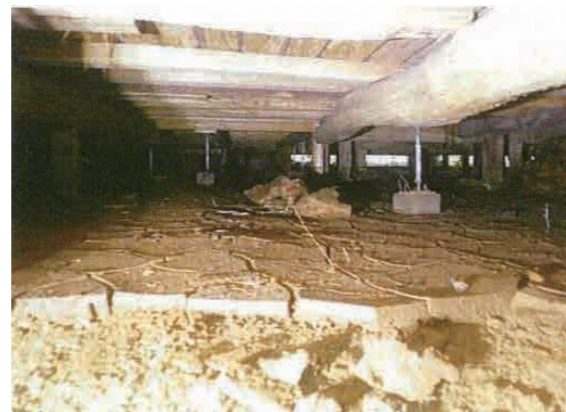
（本堂床下の被災状況）

所有者の思い 今回の集中豪雨では、本堂西側の山腹から出水し、本堂床下に大量の水と土砂が流入する被害に見舞われました。補助を得て、早期に本堂の復旧を行うことができました。今後とも、地域活動の拠り所として、本堂の保全に努めて行きたいと思えます。