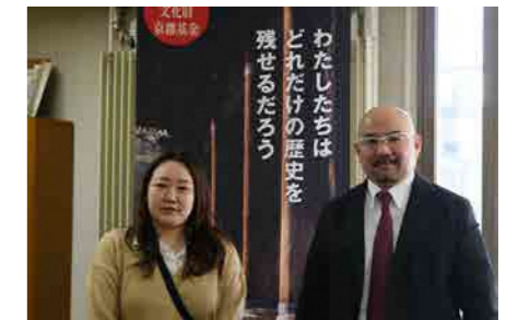
令和5年3月眞鍋代表取締役へ訪庁いただき、感謝状を贈呈させていただきました。