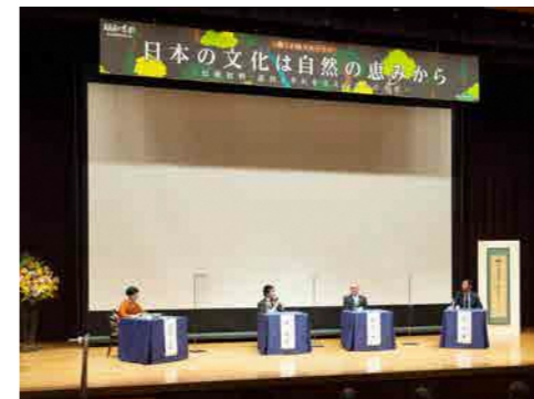
（フォーラムの様子）

明日の京都 文化遺産プラットフォームでは、文化遺産の現代的な課題を見出し、未来に向けてその存在意義を高めていくため、様々な事業実施に取り組んでいます。今回は京都の文化遺産を取り巻く動向を踏まえた方策を考究するフォーラム「日本の文化は自然の恵みから～伝統材料・道具とそれを支える人々の未来」を開催しました。また、無形文化遺産シンポジウムでは文化を後世へ継承するため親子で楽しめる「笑いは和らい～ことば遊びと狂言～」を開催しました。