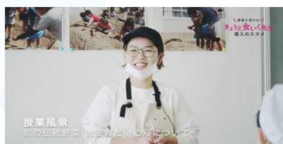
舞鶴佐波賀だいごんの授業（小学校）

きょうと食いく先生の授業の様子や、関係者へのインタビュー動画をYouTubeに掲載しています。