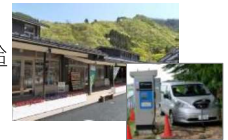
EV車等への給電設備