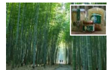
竹林を多分野で利用した観光事業