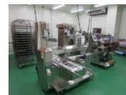
農林水産物 処理加工施設