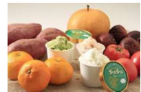
農林水産物を利用した新商品開発