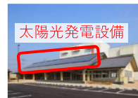
太陽光発電設備 販売・交流施設等