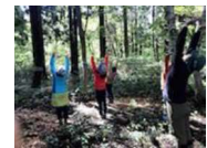
森林を利用したヒーリング事業