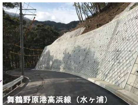
舞鶴野原港高浜線 (水ヶ浦)