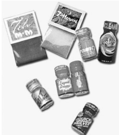
吐き気や手足のしびれ、意識障害等を引き起こしたり、死亡することもあります。

違法ドラッグは「脱法ドラッグ」「合法ドラッグ」「合法ハーブ」などと称して販売され、大変危険です! たとえ「合法」などと称していても、麻薬や覚せい剤と同じかそれ以上の恐ろしさを持つ物質です。