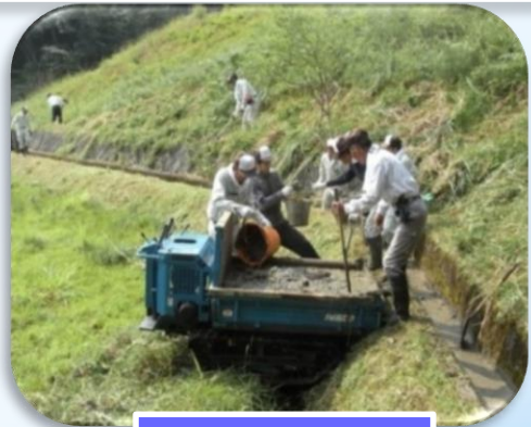
農村ボランティア