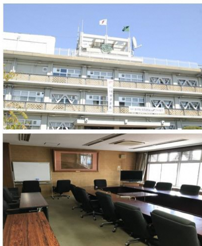
※出展ブース設置箇所の写真は一例となります。